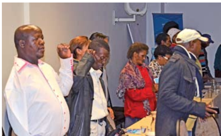
CLSA lede by die Algemene Jaarvergadering in Kaapstad

Die belangrikste kwessie vir die vissers in KZN is om weer te praat oor die kwessies rondom die implementering van die SSFP, wat, soos dit vir hulle lyk, tot stilstand gekom het.