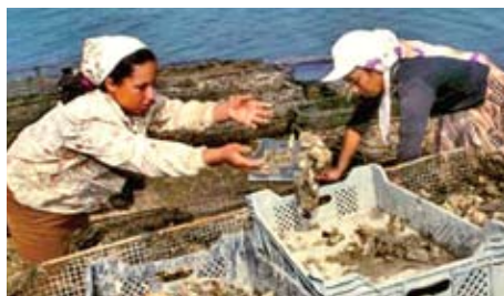
Vrouens speel alreeds 'n toenemende belangrike rol in die visbedryf

Dit gebeur dikwels dat hierdie benadering mans as vissers teiken, en vroue as die prosesseerders en bemerkers van visprodukte. Hierdie veralgemening het die bestuur van die visbedryf blind gemaak vir vroue se ander waardevolle insette tot die sektor. Hulle rolle kan en moet trouens verby dié van betrokkenheid ná die oes en bemerking gaan. Die gebrek aan die gebruikmaking van hulle addisionele bydrae het egter vroue se deelname weggelei van die bestuur van die visbedryf