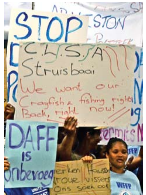
CLSA lede protes vir regte in Kaapstad

Die SSFP is ingestel om die waardigheid van die kleinskaalvisserse in ere te herstel, en om voedselsekureitheid en 'n volhoubare bestaan te voorsien.