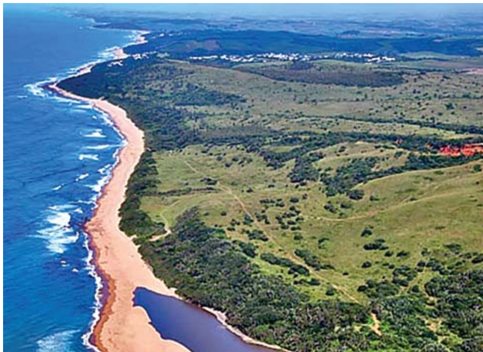
Die kusdorp, Nonoti in Kwazulu-Natal

Maar volgens South Africa Venues beteken die stadsuitbreiding van Durban al langs