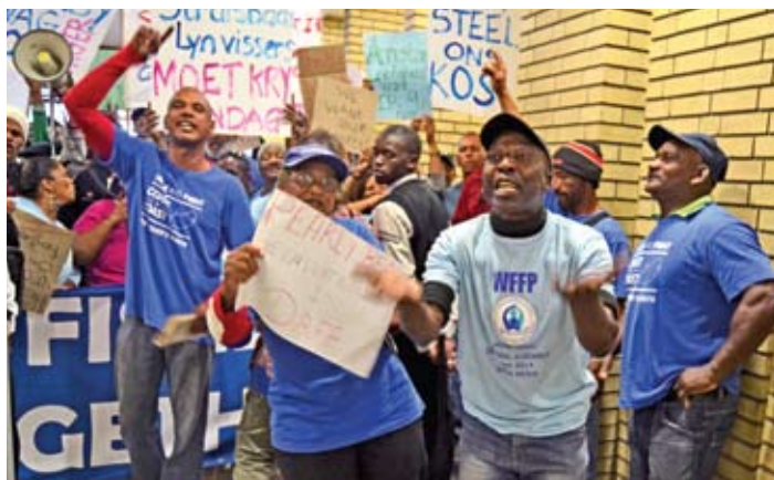
CLSA Weskaap lede by 'n protes optog in 2015