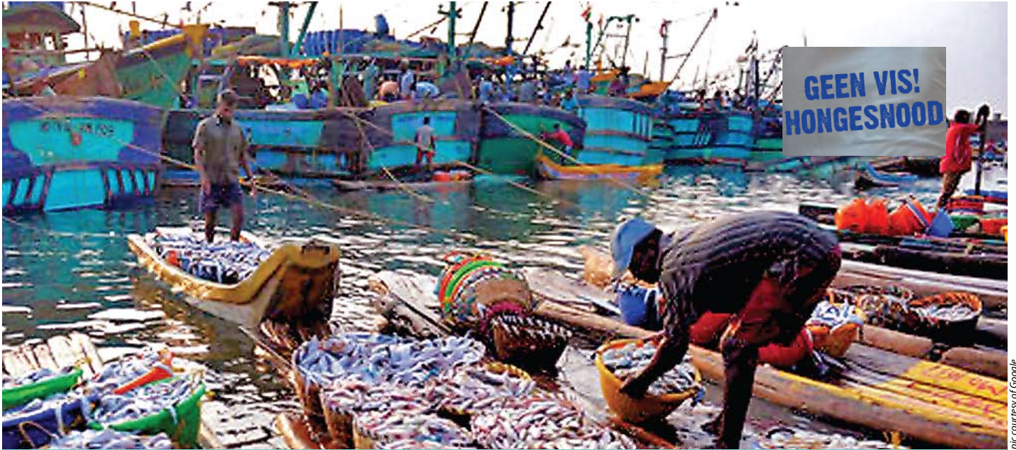
Kleinskaalse vissers verwag om 'n mandjie van mariene spesies onder die Kleinskaalse Visserye Beleid te kry

IN Februarie 2015 het die Departement van Landbou, Bosbou en Visserye (DAFF) begin met die implementering van die Kleinskaalvissersbeleid (SSFP) deur die vrystelling van die Kleinskaalvissersforum (Small-Scale Fisheries Forum), wat die Konsep-Regulasies vir Openbare Kommentaar en die vraag na die Uiting van Belangstelling (Expressions of Interest) aangekondig het.