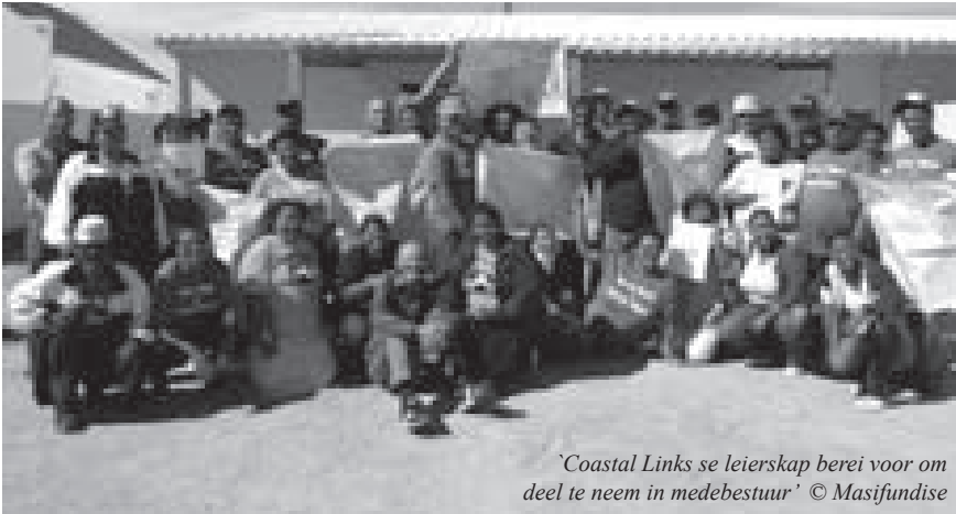
'Coastal Links se leierskap berei voor om deel te neem in medebestuur'